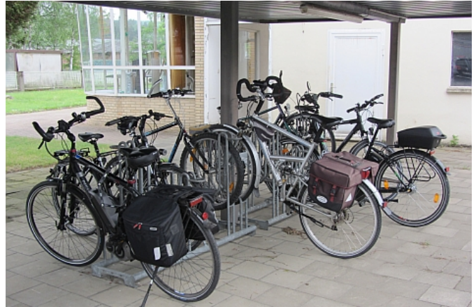
Fahrradabstellanlage mit ADFC-empfohlenem Modell "L15"