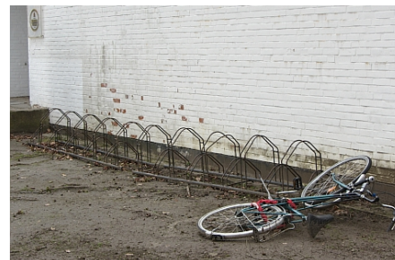
Fahrradstand Restaurant Rokoko