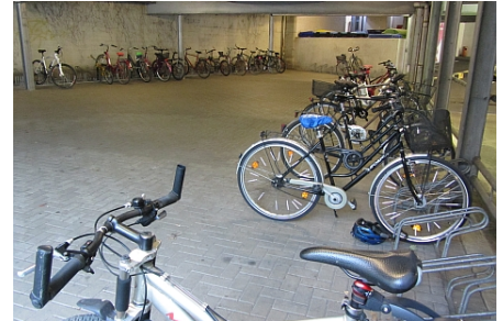
Fahrradstand im Parkhaus