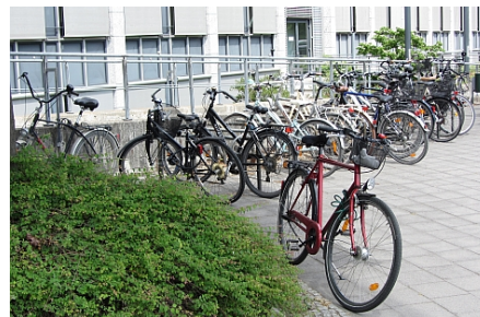
Überlasteter Fahrradstand am Eingang: 18 Fahrräder/10 Stellplätze