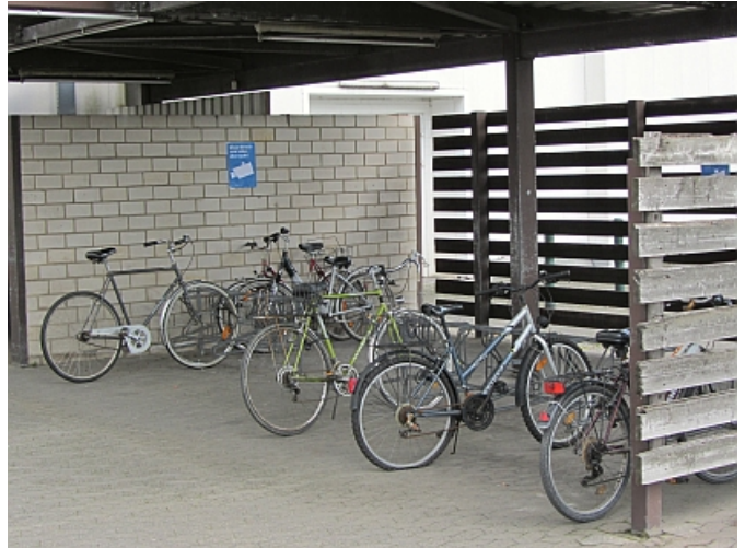
Situation an einem Sonntag: herrenlose Fahrräder?