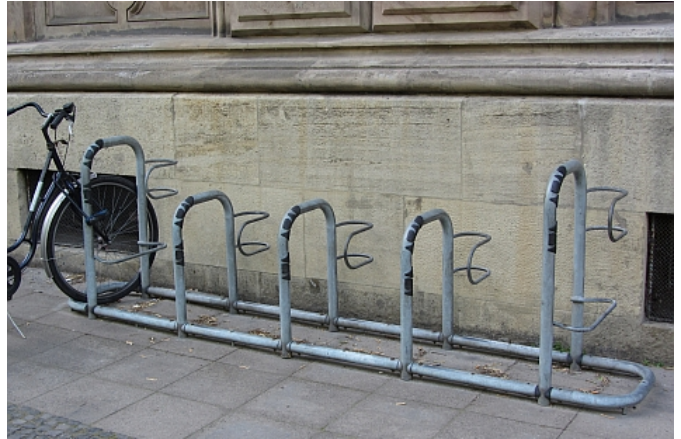
Fünfergruppe Abstellbügel im 60cm-Abstand