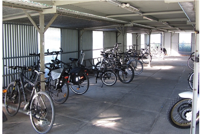
Unterstand für Fahrräder und Motorräder