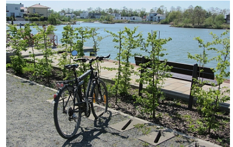
Fahrradstand "Havarie": Fahrrad-Havarie nicht ausgeschlossen...