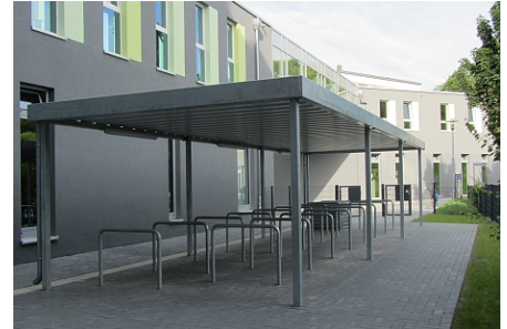
17 Anlehnbügel im 120cm-Abstand