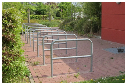
neun Anlehnbügel auch für Kinderräder (Querstrebe in 40cm Höhe)