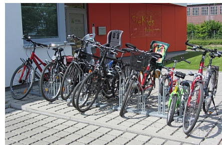
zehn Halterungen hoch/tief im 35cm-Abstand