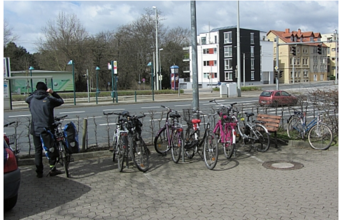
Es stehen nur 3 Anlehnbügel zur Verfügung