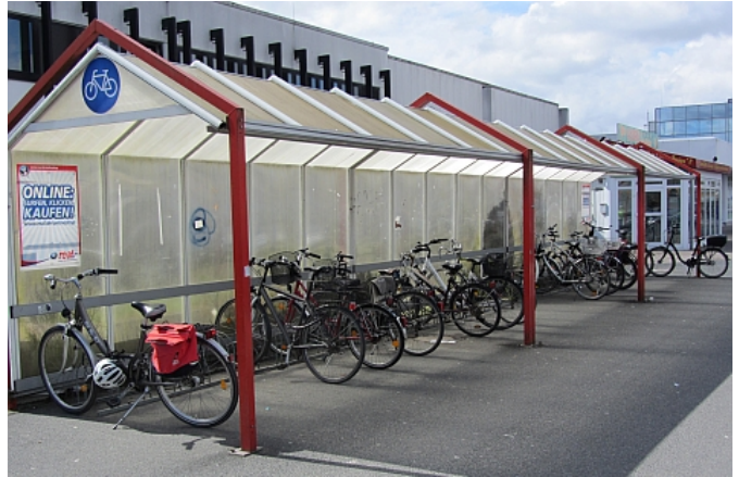
36 Stellplätze mit 36cm Seitenabstand in Hoch-/Tiefstellung