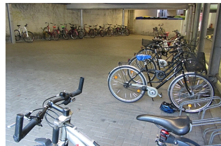
Fahrradstand im Parkhaus